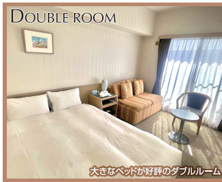
大きなベッドが好評のダブルルーム