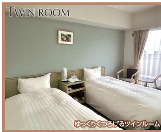
ゆっくりくつろげるツインルーム