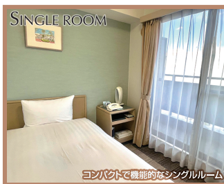
コンパクトで機能的なシングルルーム